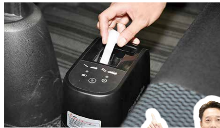
液剤を機械に入れて車内に拡散。約25分の施工、数分の換気でOK