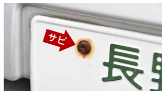
一般的なボルトはサビすることも。ナンバープレートロックのボルトはサビに強く長期間キレイ!

ナンバープレートロックはNissanブランドロゴステッカーやe-POWERロゴステッカー付きなので、とても格好いです