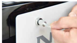
ナンバープレートロックを施工すると、取り外しは適合する専用キーでしか行えなくなります

車の部品狙いの盗難において約半数以上がナンバープレートとホイール。盗難品は2次犯罪に使われる可能性大。盗まれてしまった場合、警察署や市町村役場などへの申請、再取得には時間と費用がかかります。当社のナンバープレートロックは、専用キーでのみ着脱が可能になり、しっかりロック。市販工具での取り外しが困難なのでナンバープレートの防犯対策として効果的です。また、重層メッキ加工によりサビに強く、長期間美観を保ちます。ホイールの盗難にも注意したい人には、ホイールロックもおすすめます。