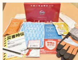
日産オリジナルデザインの箱に入っています。車内に常備したいアイテム