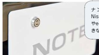
Nissanブランドロゴはオシャレで個性的な演出にも最適

ナンバープレートロックはNissanブランドロゴステッカーやe-POWERロゴステッカー付きなので、とても格好いです