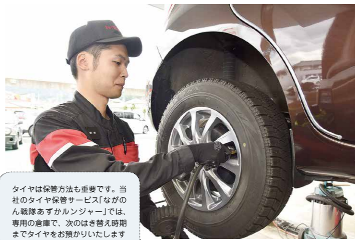
タイヤは保管方法も重要です。当社のタイヤ保管サービス「ながのん戦隊あずかるタイヤ」では、専用の倉庫で、次のはき替え時期までタイヤをお預かりいたします

タイヤには「クルマを支える」「衝撃を吸収する」「動力を伝える」「操縦する」という重要な役割があります。「摩耗」「ゴムの劣化・ヒビ割れ」「外傷」など損傷した状態で走行し続けるとスリップやパンク、バーストを引き起こす可能性があります。「タイヤのパンク」に関するJAFロードサービス出動件数はここ10年で1.5倍に増加しています。タイヤ点検で確認された不良項目の66%は空気圧不足との結果もあります(タイヤの空気圧は1カ月で平均5%程度低下します)。こまめな点検を行うことによって、タイヤのトラブルを防げます。