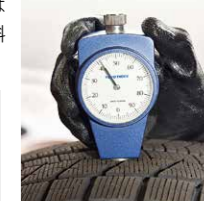
点検時にはタイヤが硬くなっているが、硬度計を使ってチェック!