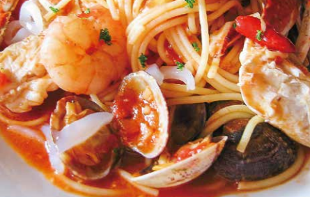
肩肘張らずにイタリアン! 1.魚介をふんだんに使った「ペストーレ」(1,650円)もファンの多い一品 2.ピザの一番人気は「アンチョビとマッシュルームのピザ」(L:1,450円、S:1,200円)。定番の「マルゲリータ」(L:1,450円、S:1,200円)をも凌ぐほどの人気ぶりとか 3.明るい雰囲気店内