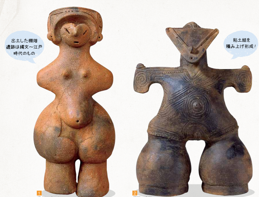
出土した棚畑遺跡は縄文〜江戸時代のもの