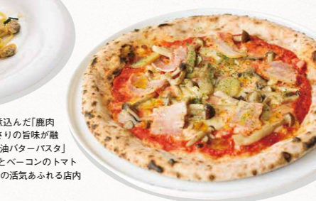
1.信州美ヶ原産の鹿肉を一晩かけてじっくり煮込んだ「鹿肉のラグーパスタ」(1,480円)。2.信州味噌とあさりの旨味が融合したシェフイチオシの「帆立とあさりの味噌醤油バターパスタ」(1,440円) 3.薪で香ばしく焼き上げた「きのこベーコンのトマトソースピッツァ」(1,380円) 4.オープンキッチンの活気あふれる店内