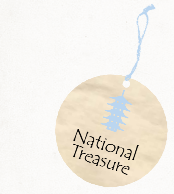
1 縄文のビーナス 棚畑遺跡から出土した、全長27cm、重さ2.14kgの国宝土偶。お腹とお尻が張り出したふくよかな身体は妊婦をデフォルムして作られたといわれている。雲母が混ざった粘土で作られているため、光に当たるとキラキラときらめく 2 仮面の女神 中ッ原遺跡から出土した、全長34cm、重さ2.7kgの国宝土偶。仮面を付けたような風貌をしていることから、この名が付けられた。胴体部分には渦巻きや同心円、たすきを掛けたような文様が施されている。約4000年前の作といわれる