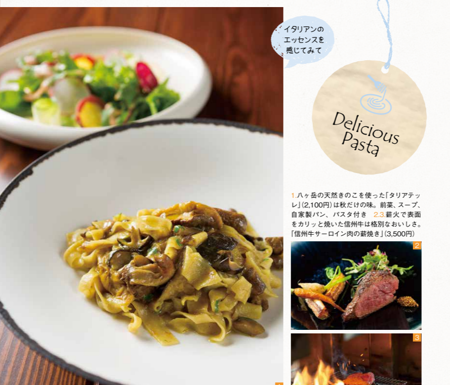
イタリアンの エッセンスを 感じてみて

シェフの創作肉料理も充実! 信州の食材と旬の食材をふんだんに使ったパスタは、好みに合わせて生パスタか乾燥パスタのどちらかを選択することが可能。イタリア製の窯で焼き上げる本格ピッツァも絶品で評判を呼んでいる。食後は、パティシエが作る彩り豊かなケーキがオススメ! 〒諏訪市中洲5723-3 諏訪ふれあい広場内 ☎0266-56-3203 開館時間 11時～15時(14時LO)、ティータム14時～17時(フード販売なし)、ディナータイム17時～22時(21時LO) 休水曜 入館料 250円(諏訪ふれあい広場共用Pを利用) 中央道諏訪ICから車で約6分