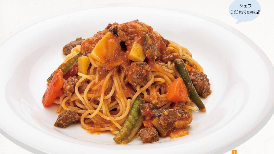
シェフ こだわりの味♪

3.10月12日(土)～12月15日(日)は「特別企画展やまとうた 三十一(みそひと)文字で綴る和の情景」を開催。優れた歌人の和歌と肖像画を描いた「歌仙絵」のひとつ「上叢本三十六歌仙絵 大中臣能宣像」(重要文化財)を展示 4.他にも、国宝の掛け軸「寒山図」(常設展示無し)を所蔵 東洋の古美術や西洋近現代絵画などを所蔵。9月29日(日)までは、茶碗に焦点を当てた特別企画展「茶人に愛された数々の名碗」を開催していて、国宝に指定されている「白楽茶碗 銘 不二山」や、幻の名碗「赤楽茶碗 銘 障子」などを鑑賞することができる 〒諏訪市湖岸通り2-1-1 ☎0266-57-3311 開館時間 9時30分～16時30分 休月曜(祝日は開館) 入館料: 大人1,100円、小中学生400円 入館料 70円 中央道諏訪ICから車で約15分