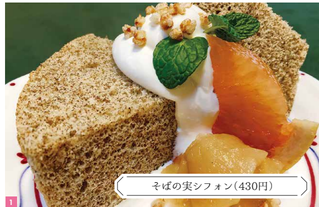
そばの実シフォン(430円)

ヘルシーで 素朴な味わいの そばシフォン シフォンケーキの 前にピザも 食べてみたい! 1.そば粉でつくる素朴なシフォンケーキ。生クリームの上にはそばの実をトッピング。ほかに4種類のケーキを展開 2.「サラダPizza」(S:970円/L:1,400円)。そば粉のピザ生地の上に生ハム入りのグリーンサラダをたっぷりのせたヘルシーな一品 3.夏はテラス席が大人気!