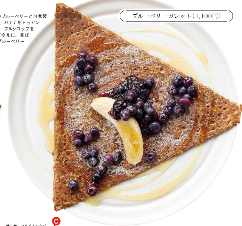
ブルーベリーガレット(1,100円)

「3301ガレット」(1,300円)。ゴードナーズとベーコン、卵、オリーブオイルで炒めた信州産のキノコをトッピングした食事系ガレット。しっかり食べ応えがあるので、朝食やランチメニューとしても大人気!