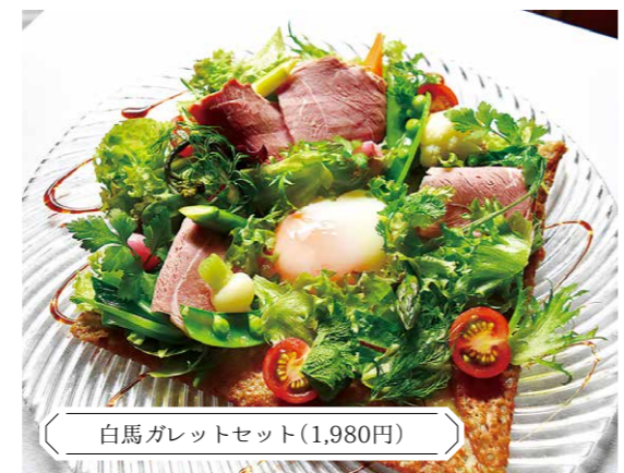
白馬ガレットセット(1,980円)

〒183-0444 北安曇郡白馬村北城4744和田野の森 ☎0261-72-7111 ☎レストラン: ランチ12時~13時30分LO、ディナー18時~20時LO ☎不定休(要問い合わせ) ☎上信越道長野ICより車で約60分、長野道安曇野ICより車で約65分 ☎30台