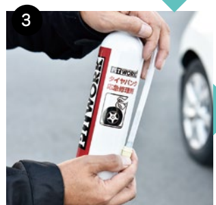
③修理剤を上下に15秒ほどよく振り、バルブキャップの付いていた空気注入口へ回し込みます。