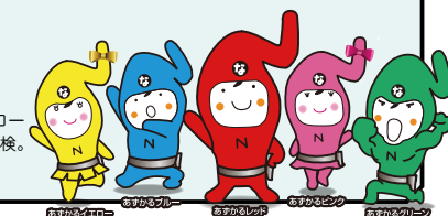
赤のリーダー、青の予約、黄のタイヤ、桃の点検、緑の交換

キャラクターはレッドがリーダー、イエローが予約、ブルーがタイヤを守り、ピンクが点検。グリーンは買い替え時期を教えてください