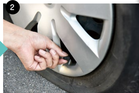
②タイヤのバルブキャップを回して外します。

タイヤパンク応急修理剤は、あくまで応急修理です。使用後はできるだけ早く日産のお店にて本修理またはタイヤ交換を依頼してください!