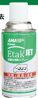
EtakJet ® 車室内コーティング料金 5,500円~ (施工費込み)

幅広い抗菌・抗ウイルス・消臭作用 車室内空間での優れた抗菌、抗ウイルスバリア、防カビ効果に加え、消臭作用を發揮します。