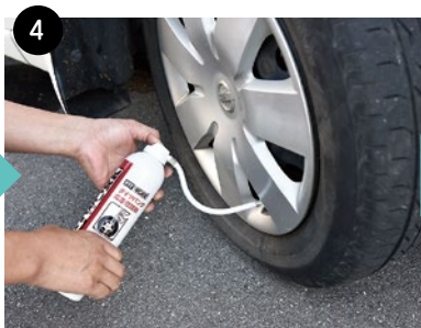
④容器のふたを外し、垂直を保ったまま噴射ボタンをプシューッと押して液剤を注入(約60秒から75秒、噴射音が聞こえなくなったら注入終了)。