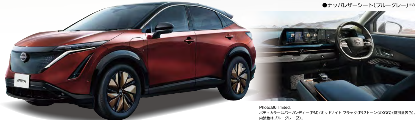
Photo:B6 limited. ボディカラーはパーガンディー(PM)/ミッドナイト ブラック(P)2トーン(#XGG)(特別塗装色)。 内装色はブルーグレー(Z)。