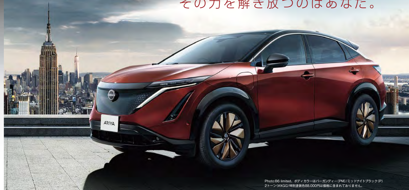
Photo:B6 limited. ボディカラーはパーガンディー(PM)/ミッドナイトブラック(P)2トーン(#XGG)特別塗装色88,000円は価格に含まれておりません。

ARIYA limited 予約注文受付中! 通常モデルに先駆けて生産、お届け! (予定)