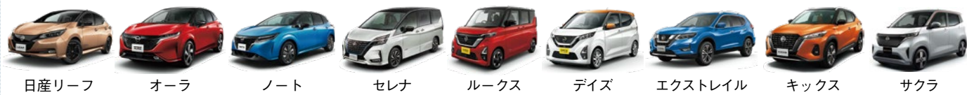
日産リーフ オーラ ノート セレナ ルックス テイズ エクストレイル キックス サクラ

※プロパイロットの設定条件は、車種・グレードにより異なります。詳しくはカーライフアドバイザーまでお問い合わせください。