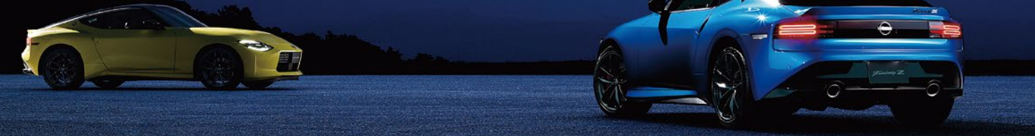
Photo:フェアレディZ Version S。ボディカラーはセイランブルー(3PM)/スーパーブラック2トーン(※XJR・スクラッチシールド)特別塗装色176,000円は価格に含まれておりません。内装色はブラック(G)/ファブリックシート。※画面はハメ込み合成です。

フェアレディZは、消費税込車両本体価格5,241,500円(フェアレディZ(3000cc ツインターボ/GMT/2WD))からお求めいただけます。