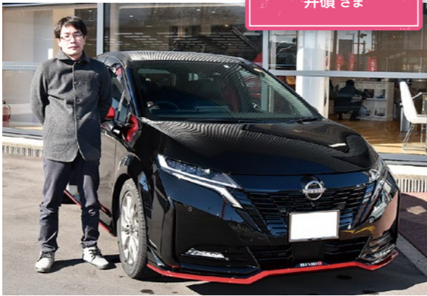
車種 | オーラ ニスモ 井碩さま