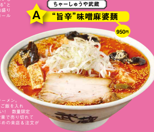
チャーシューや武蔵 950円 A “旨辛”味噌麻婆麺

松本「大久保醸造」の甘露醤油が味の決め手。タレにはほかの調味料や出汁素材は使わず、甘露醤油の風味や香りなど、おいしさをストレートに表現させた。スープは旨味あふれる鶏ガラベース