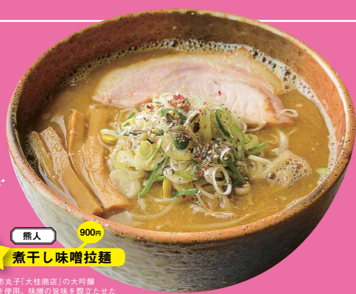
熊人 900円 C 煮干し味噌拉麺

上田市丸子「大桂商店」の大吟醸味噌を使用。味噌の旨味を際立たせたスープに煮干し粉を合わせ、風味を重ねている。スープの上には粗挽きの煮干し粉とピンクペッパーをトッピング。