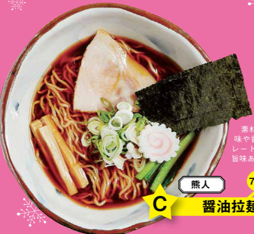
熊人 750円 C 醤油拉麺

イチオシ「豚基本」に唐辛子や豆豉などの刺激的な辛味を加えたホットなラーメン。辛いもの好きからも「クセになる」と評判を呼んでいる。山盛りの野菜と巨大なバラロールはコチラでも健在!