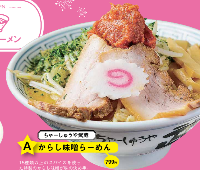
チャーシューや武蔵 799円 A からし味噌らーめん

ご飯が進む旨辛ラーメン。余った麻婆ダレにご飯を入れると、二度おいしい! 数量限定のため、お昼の営業で売り切れてしまうことも。早めの来店&注文がおすすめです。