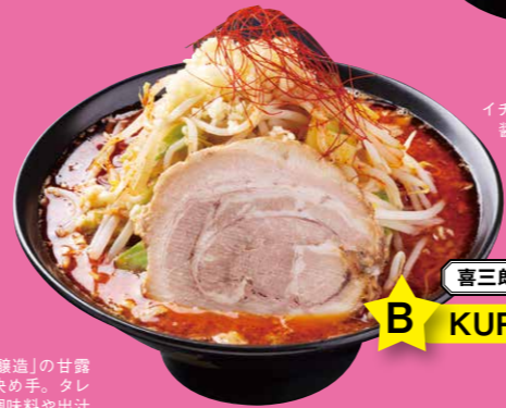
喜三郎 870円 B KURENAIの豚

豚の旨味がたっぷり詰まったスープに、香り豊かな国産小麦の平打ち麺を合わせたパワフルな一杯。麺の上には、シャキシャキの野菜タワーがこんもりと盛られていて、食べ応えも満点!