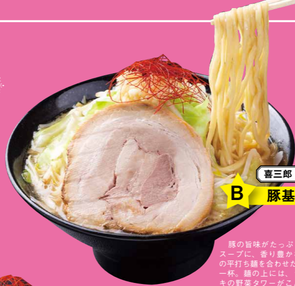
喜三郎 780円 B 豚基本

上田市丸子「大桂商店」の大吟醸味噌を使用。味噌の旨味を際立たせたスープに煮干し粉を合わせ、風味を重ねている。スープの上には粗挽きの煮干し粉とピンクペッパーをトッピング。