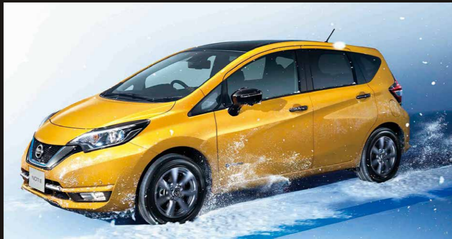
Photo: e-POWER MEDALIST FOUR ブラックアロー。ボディカラーはサンライトイエロー(P)/スーパーブラック2トーン(ブラックアロー専用色)(#XBL)特別塗装色23,760円は価格に含まれておりません。

雪や雨で前輪が空転する前に、素早く自動で2WDから4WDに切り替え、スムーズな発進・加速を実現