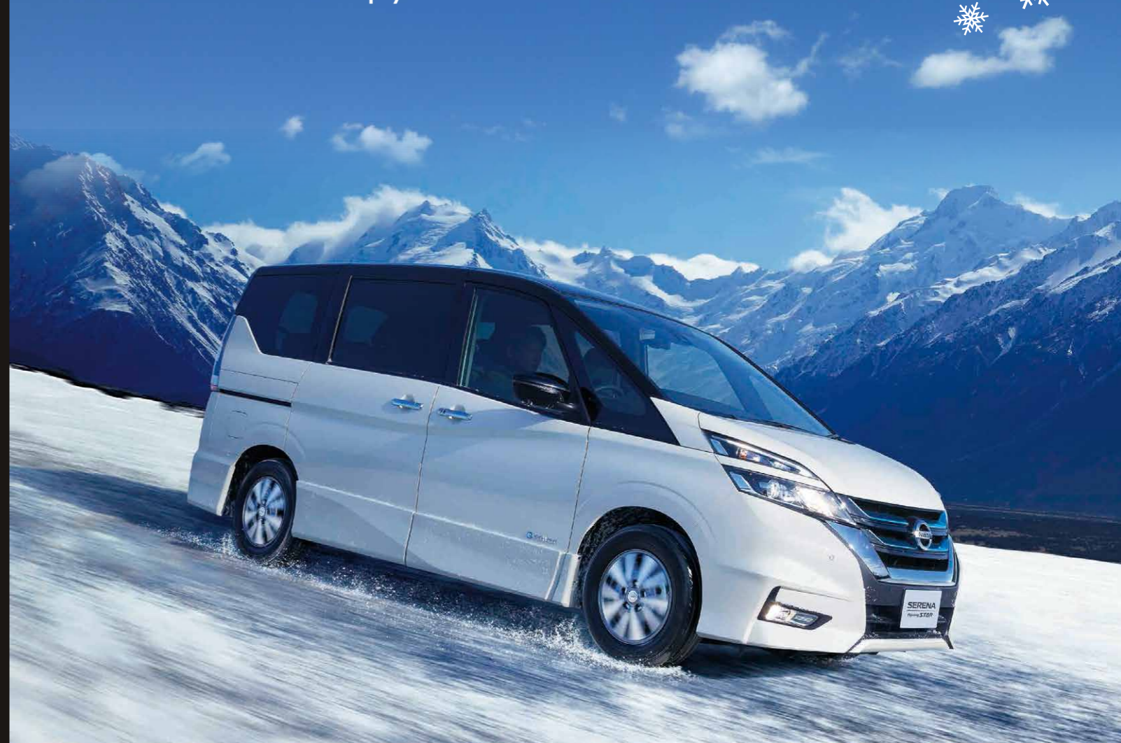
Photo: セレナ e-POWER ハイウェイスターV。プリリアントホワイトパール(3P)/ダイヤモンドブラック(P)2トーン<#XAM>特別塗装色75,600円は価格に含まれておりません。