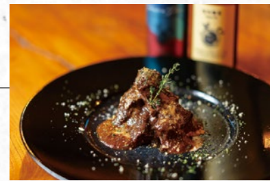
ラウンジではサ飯を提供。メニューは季節ごとに入れ替わり、この日は「鹿肉の赤ワイン煮」(1,400円)がお目見えした。アルコールやノンアルコールドリンクも充実している