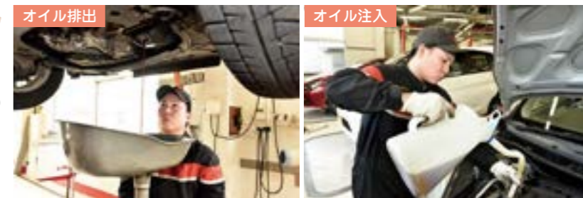
▲古いエンジンオイルはきれいに抜いて新しいオイルを入れます

ひと口にエンジンオイルといってもたくさんの種類があります。日産車のエンジン性能を十分に発揮できる日産純正オイルまたはペトロナスオイルがおすすめ。日産純正オイルSNストロングセーブXは省燃費性能に優れたモリブデンを配合した高性能ガソリンエンジンオイルです。ペトロナスオイルはレース活動で培った経験を活かし開発されたスポーツオイル。高負荷運転(長時間走行、上り坂走行)でも変わらず性能を発揮します。