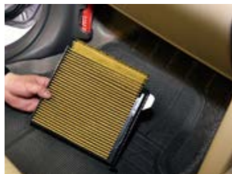
フィルター交換をして、涼しい車内で夏を過ごしたいですね

エアコンのクリーンフィルターは、外気から取り込む空気を清浄化すると同時に車内の空気循環で室内に入ったホコリなどを取り除きます。放っておくとフィルターの目詰まりにより通気が悪くなり冷房性能が低下します。1年でかなり汚れてしまうので、毎年交換したいところです。おすすめフィルターは「クリーンフィルタープレミアム」。強力な3層構造でビタミンCも放出します。