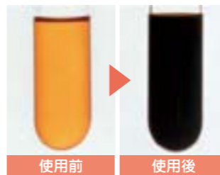
新品のエンジンオイル(左)、劣化したエンジンオイル(右)。黒くなったオイルはエンジンの性能を悪化させます

エンジンオイルは人間でいう血液のようなもの。エンジン内部の隅々まで循環することが大切です。オイルの流れが止まってしまうと、車は動きません。今回は高性能で種類豊富なエンジンオイル商品をおすすめします。そのほか、オイルフィルター、エアコンフィルターなどの各種フィルターも併せてご紹介いたします。