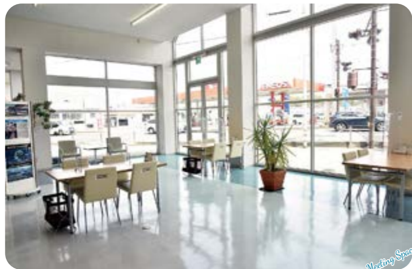
ガラス張りで開放的な商談スペース。リラックスしてお過ごしください