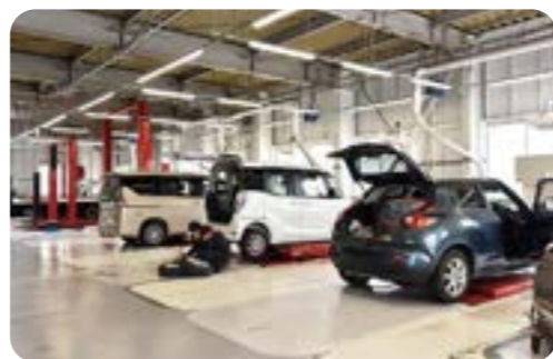
ニーズに合ったおすすめ商品の施工もおまかせください