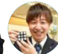
関さんはルービックキューブが趣味。冬はスノーボードにもハマっています