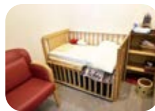
授乳室にはベビーベッドがあり、とても使いやすい空間