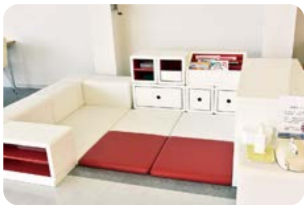
赤白ツートンの清潔感あふれるキッズスペースも好評