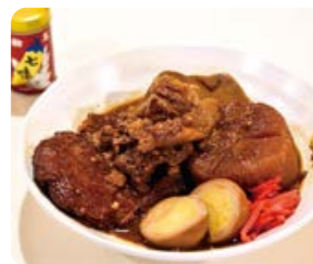
上/「上田味噌おでん」(単品150円~)の具材は大根、牛すじ、玉子など 左/広々とした店内はポップな色合いと落ち着いた木の壁が融合した空間

海野町商店街にあるおしゃれなカフェ&バーです。昼はラム酒の香りを利かせたフワフワクリームが味わえ、夜はラム酒などのお酒も楽しめます。おすすめしたいのが地元・山辺靴店の味噌を使った「上田味噌おでん」。見た目はこってり濃厚ながら、さらりとした味わいの変わり種のおでんで、味噌の風味が最高です。ハードサイダー(シールド)と合わせてどうぞ。