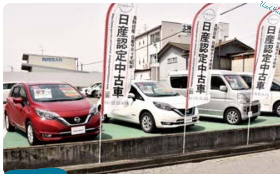
お気軽にスタッフまでお問い合わせください!