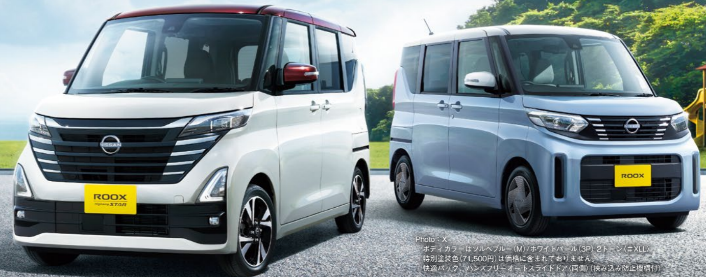
Photo: X ボディカラーはソルベブルー(M)/ホワイトパール(3P) 2トーン(≠XLL) 特別塗装色(71,500円)は価格に含まれておりません。 快適バック、ハンズフリーオートスライドドア(両側)(挟み込み防止機構付) Photo: ハイウェイスター Gターボ プロパイロットエディション ボディカラーはホワイトパール(3P)/カンジューカス(P) 2トーン(≠XLK) 特別塗装色(71,500円)は価格に含まれておりません。