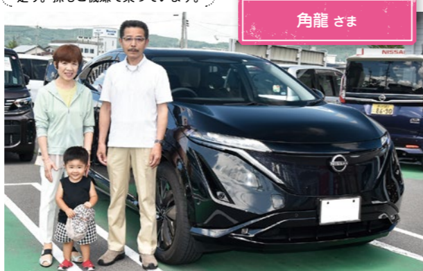
車種 アリア 角龍 さま