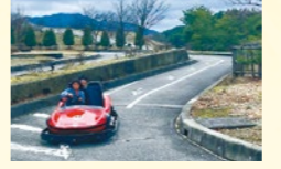
1周780m。坂道やヘアピンカーブなど、起伏に富んだコースはスリル満点！

ゴーカートやマレットゴルフ、遊具、BBQ広場、自然博物館などを有する集合型の道の駅。食堂では、地元産の長芋を使った「白いビーフシチュー」や「山賊焼き」など、信州産食材を使ったメニューも展開している。