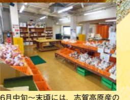
6月中旬～末頃には、志賀高原産のネマガリダケが農産物直売所に並び

900円 「ラーメンの神様」と呼ばれた山岸一雄氏の故郷・山ノ内町で、幻のカレーライスが復刻。濃厚なルーにはラーメンのスープとそばつゆが使われている。