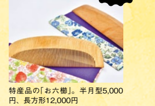
特産品の「お六櫛」。半月型5,000円、長方形12,000円

図木曾郡木祖村萩原163-1 ☎0264-36-1050 直売所：9時～17時 食堂：10時～16時LO 休なし ※12月～3月は木曜 P52台 図中央道塩尻ICより車で約40分