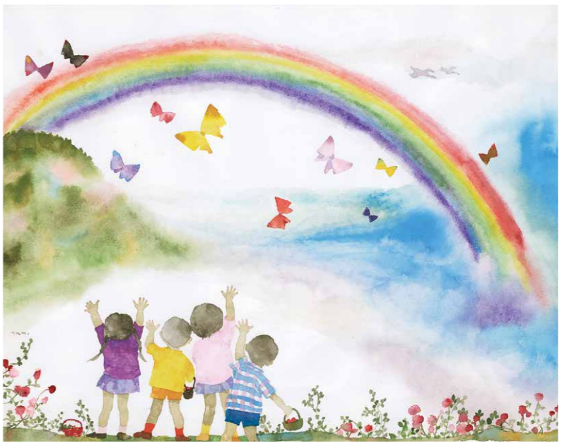
いわさきちひろ「にじのはし」1963年