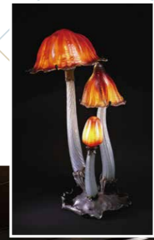
エミール・ガレ「ひとと葎」1904年頃

CHECK 「ひとと葎タオルハンカチ」(各660円)や高さ約6cmの「ミニチュアガラスひとと葎」(1,320円)、「春草文グラス」(各1,980円)などのグッズも販売している。